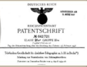
Werner von Siemens