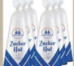
Andreas Sigismund Marggraf